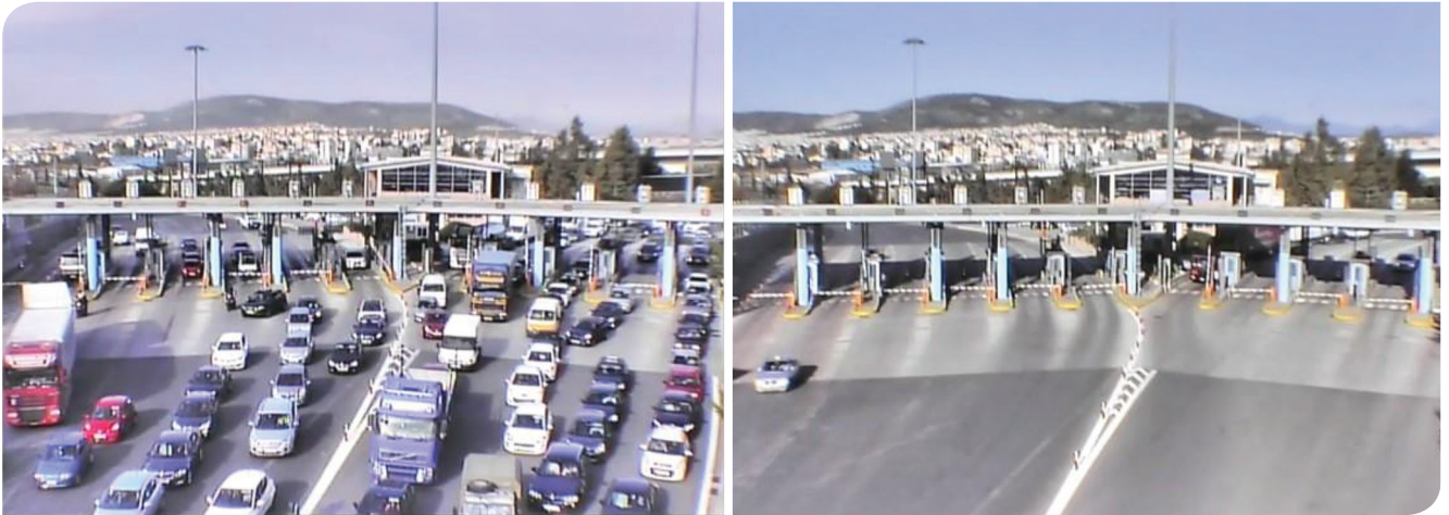
Consecuencias del Covid-19 en la red HELLASTRON de Grecia, peaje de Attica, plaza metamorfosis este, el día 5 de marzo y el día 2 de abril de 2020 a las 8:57

urgente o acciones llevadas a cabo por administraciones de carreteras y transporte durante la crisis que también pudieran resultar útiles en otros lugares, el Equipo de respuesta a la COVID-19 de PIARC rápidamente organizó una serie de seminarios web para que profesionales y expertos intercambiasen sus experiencias, su conocimiento y algunas de las respuestas más eficaces respecto a la COVID-19. Es cierto que estas prácticas actuales no se han aprobado completamente, y también es cierto que aquello que funciona en algunos lugares del mundo podría no funcionar a nivel global, pero estas experiencias compartidas pueden ser buenas herramientas para la gestión de esta crisis, en la que una buena idea podría salvar vidas, mejorar la resiliencia de los negocios y minimizar un efecto disruptivo en el servicio ofrecido, tanto ahora como en el futuro. Este artículo presenta algunas de las observaciones y lecciones clave de dichos seminarios.